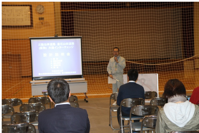
▲ 担当職員による説明

実施内容:(仮称)大槌インターチェンジ建設に伴う町道 沢山迫又線の付け替えについて関係者に説明会を開催しました。